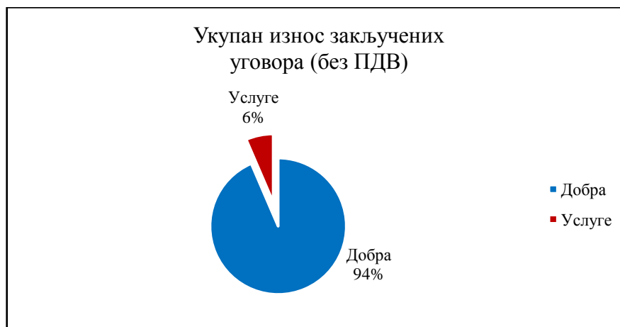
Графикон број 1 : Укупан износ закључених уговора по покренутих поступцима јавних набавки у 2018. години према предмету јавних набавки

Од укупно три покренута поступка јавних набавки у 2018. години узоркован је један поступак, и то поступак јавне набавке добара, односно од укупне вредности закључених уговора - 11.251.271,76 динара са ПДВ, узорковано је 6.262.900,00 динара тј. 56% свих закључених уговора.